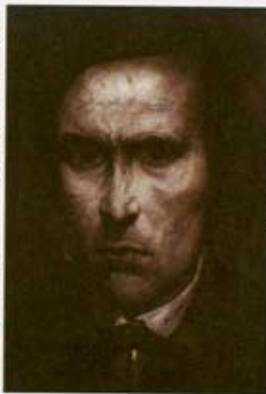
Ποιά είναι η ζωή και ποιά η κόλαση του ευφρόσεντου, ορθολογιστή διανοούμενου Ιβαν Καραμαζώφ , που κινεί τα νήματα πίσω από τον Μ. Ιεροεξεταστή; (Ηλία Γκλαζούνωφ - "Άλμπουμι Ντοστογιέφσκη").

Μ α πρώτα απ' όλα θα τους προσφέρει ψωμί. Κάθε λίθο θα τον κάνει ψωμί γιατί οι άνθρωποι πρέπει να είναι χορτάτοι. Όσο πιο πεινασμένοι τόσο πιο επαναστατικοί κι ευρηματικοί, τόσο πιο παράφορα γενναίοι. Τό γεμάτο στομάχι δίνει βαρύτητα, ακινησία, ακόμα και τις επαναστάσεις τότε μπορείς να ξεγελάσεις και να τις οδηγήσεις με χαρούμενα πλακάτ προς τη δική σου κατεύθυνση κι ας φωνάζουν. Ω, ας φωνάζουν!...Το να τους αφήνεις να φωνάζουν είναι μεγάλο τέχνασμα. Κάνει καλό στη χώνευση, είναι ευεργετικό στον ύπνο. Οποιος φωνάζει πολύ, ηρεμεί πολύ πιο σύντομα. Η ευζωία σε αιχμαλωτίζει στην απληστία της. Πάντα θα διεκδι-