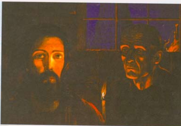
“Ο Μέγας ιεροεξεταστής” - Ηλία Γκλαζούνωφ: Ζωγραφική από τα έργα του Ντοστογιέφσκη.

Ο Ιεροεξεταστής μιλάει συνεχώς με φλόγα. Όσο και να προσπαθεί να προκαλέσει αντίλογο, ο Ιησούς σιωπά. Κι όμως, το γεγονός μεταξύ τους είναι όντως ένας διάλογος. Ο λόγος της σιωπής Του είναι δραστικότερος, πιο αποκαλυπτικός από τις λέξεις. Όποιος αμφιβάλλει καίγεται να προβάλλει επιχειρήματα, καίγεται να πείσει μήπως πεισθεί και ο ίδιος. Τό κενό ύπαρξης δεν αντέχει τον εαυτό του μέσα σε ησυχία, αναζητά τρελαμένο περισπασμούς και ήχους. Η αυτοαμφισβήτηση συχνότατα γίνεται ισχυρογνωμοσύνη κι η ρητορική αγωνίζεται ασθμαίνοντας μήπως και μοιάσει με την ακατάδεχτη γνησιότητα. Είναι αδύνατον να μιλήσεις αυθεντικά αν δεν είσαι αυθεντικός, αδύνατο να πεισθείς όταν δεν πιστεύεις. Ο Ιεροεξεταστής έχει γι αυτό ασκήσει έξοχα την τέχνη του λόγου και τα επιχειρήματα. Τό έχει δραματικά ανάγκη ο ίδιος. Γιατί φέρει την κατάρα να είναι πανέξυπνος με ατροφική καρδιά. Δέν υπάρχει πιο φριχτός μόχθος από το να αγωνίζεσαι να χτίσεις καρδιά με υλικά τη σκέψη σου και τη λογική σου.