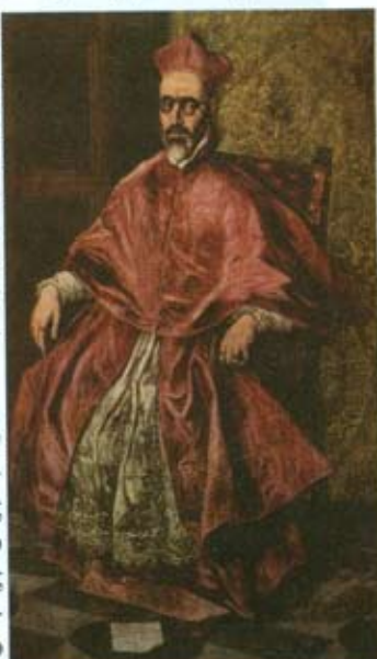
"Ο μεγάλος υπάχης" του Ελ Γκρέκο Περιβεβλημένος το κύρος της πολυτέλειας και τον πλούσιο θεολογικό λόγο της εκκοσμηκευμένης εξουσίας... Ποιά σχέση έχει με τον πλάμητα, μ' έναν απλό χιτώνα. Υιό του Ανθρώπου, που "δεν έχει, πού την κεφαλήν κλίνει;..."

Α ν ο Χριστός προσφέρει στον άνθρωπο τον πόνο, ο Ιεροεξεταστής θα προσφέρει τον φόβο. Είναι πιο εύκολα όλα έτσι. Ο φόβος αδυνατίζει τις συνειδήσεις και τις χειραγωγεί. Οι ειδήσεις για το τι συμβαίνει στον κόσμο και τι σημαίνει ζωή, απ' τη μία σε τρομάζουν κι απ' την άλλη σε κάνουν να νιώθεις τυχερός. Προς το παρόν! Φόβο απ' τη μία, ασφάλεια απ' την άλλη. Ποίος δεν ευγνωμονεί μετά από τέτοιες διπλοπρόσωπες παροχές; Είναι πιο εύκολο ν' αναστρέφεται το αξίωμα πώς, η ζήτηση καθορίζει την προσφορά. Η προσφορά του θα είναι εκείνη πού θα ορίζει τη ζήτησή τους. Αποφεύγονται εκπλήξεις επικίνδυνες και θα είναι πάντα έτοιμος να ανταποκριθεί σε ανάγκες. Οι άνθρωποι κατά βάθος τη γνωρίζουν την γλυκιά ευτυχία της σκλαβιάς τους. Κατά βάθος δεν έχουν μεγάλη διάθεση να εκτιμούν τον εαυτό τους. Ο Χριστός τους χαλάει αυτή την ευτυχία με την υπερβολική εκτίμηση πού τους έδειξε. Φαντάζονται πώς είναι πολύ κοπιαστική και μετελαϊδική τόση αυτοεκτίμηση. Σιγά το παραδέχονται πώς σε τούτο τον κόσμο, κι όπως έχουν τα πράγματα, ο δούλος